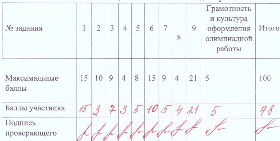
Итоговая таблица выполнения олимпиадной работы