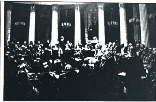
8. К. Лебедев «Сбор дани. Полюдь»