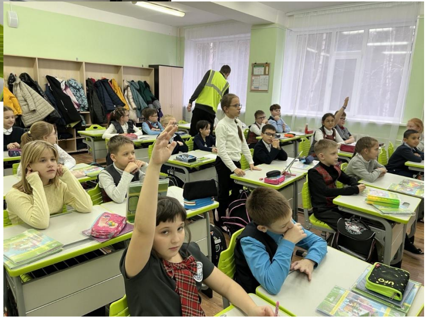
Ученики ГПД нарисовали рисунки по ПДД.