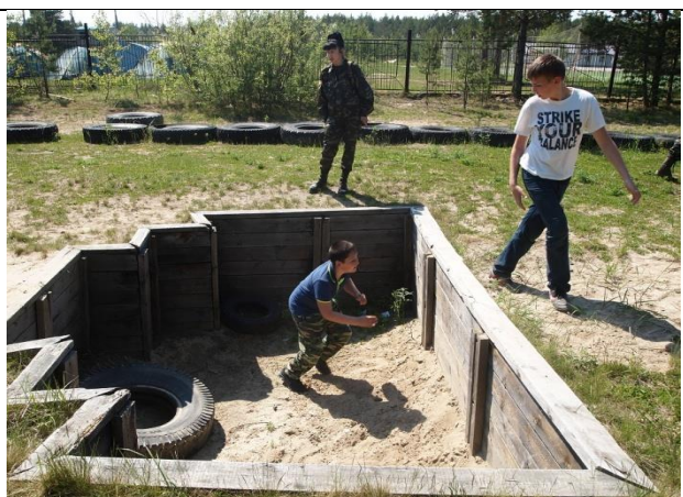
И в окопах надо побывать