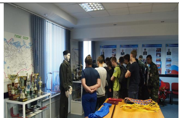
В музее ДОССАФ