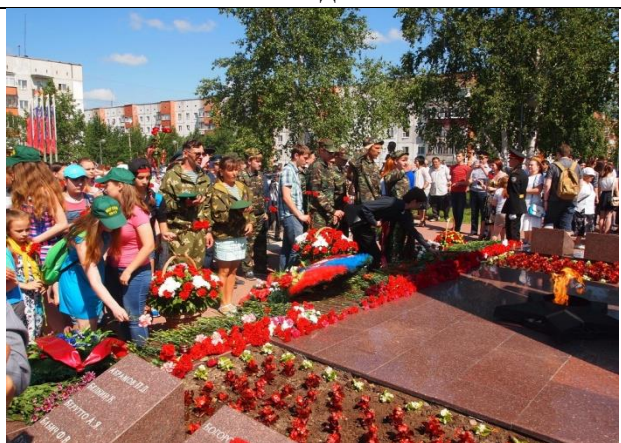
Поклонимся великим тем годам

Целесообразность данной программы заключается в необходимости непрерывного развития военно-патриотического движения. В период летних каникул данный вид деятельности решает задачи непрерывности и преемственности обучения, профилактики отрицательных социальных явлений в подростковой среде, пропаганды здорового образа жизни, обеспечивает занятость подростков и их оздоровление.